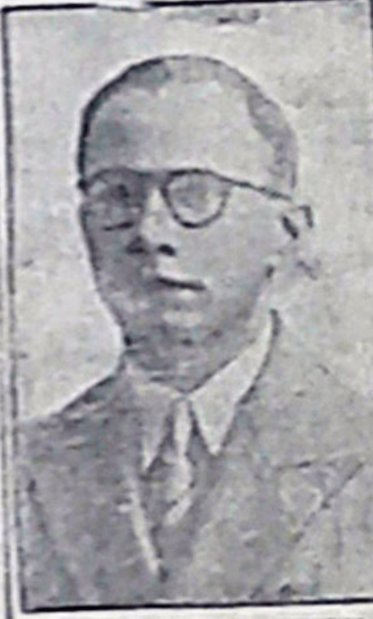
PROF. GERVÁSIO LEITE

As gestões que visam a melhorar o ensino por um melhor melhor ensino e problemas de política.