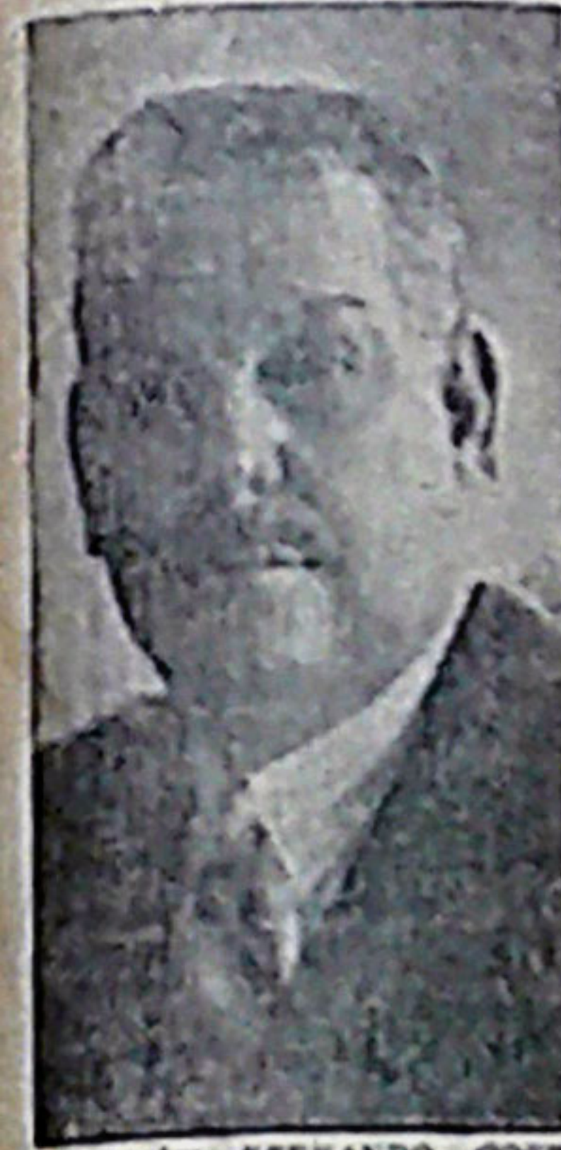
Interventor FERNANDO COSTA O núcleo central das comemorações será o grande banquete que se dá a todos os prefeitos do Estado referenciado ao Interventor Fernando Costa no Estado do Paraná.

VINTE MIL BARROCAR PRO-TESTAR PARA A AÇÃO LONDRES, 3 (ESTADO) — Te- o terceiro aniversário da administração Fernando Costa S. PAULO, 3 (ESTADO) — Projeções de grandes festas em homenagem ao Interventor Fernando Costa pela passagem do 3.º aniversário de sua administração.